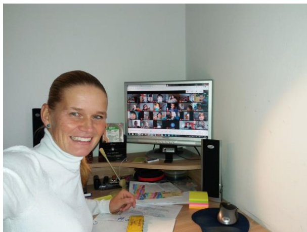
Ani online výuka nepostrádá humor.

Věříme, že se nám podaří umožnit online výuku pro všechny žáky naší školy s vaší laskavou pomocí.